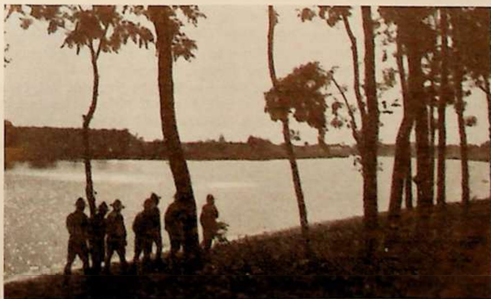
MÁV eserkészek a Tisza partján