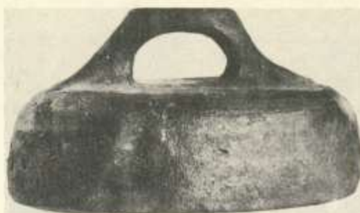
Az ásás során előkerült 14-15. századi ausztriai kerámia edényfedő

kor egy korábbi, előző századi települést bolygattak meg, pusztítottak el. Az épület pontos alaprajzát nem ismerjük, sajnos nem is valószínű, hogy megismerhetjük. A barokk kori épületek, s pincéik létesítések a középkori falak jórészt elpusztultak. Az udvarház ÉNy-ra néző frontja a Városháza keleti szárnya, déli sarokrésze alatt lehetett. Az udvaron és a sörözőnek átalakított pincében már nem találtunk középkori falakat. Az udvarház a török korban legalább kétszer égett le az észlelt égési-pusztulási rétegződések szerint. Ezek az események a történeti források tanú-