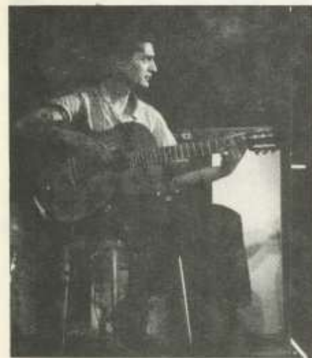
Snétberger Ferenc gitáros, a március 21-én Trio Stendhal koncert egyik előadóművésze.