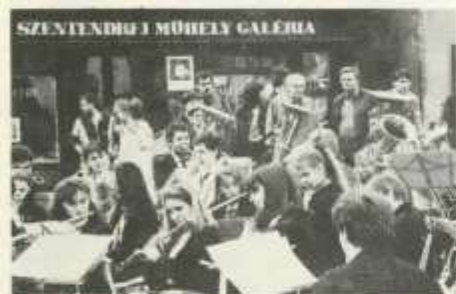
A Vujicsics Tihamér Zeneiskola fúvósegyüttesének hangversenye a Fő téren március 23-án