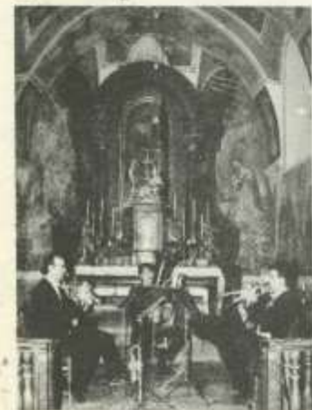
Húsvéti hangverseny március 31-én a Várdombi templomban