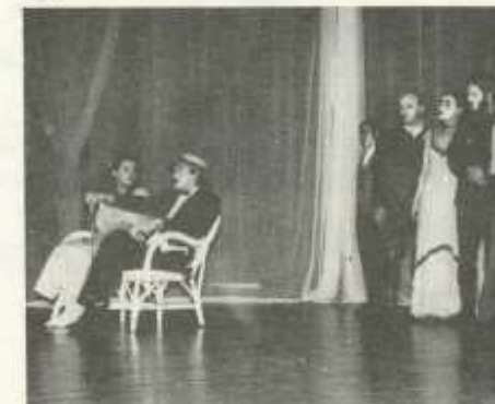
Operetka. Az R.S.9 Stúdiószínház előadása március 22-én a PMKK színháztermében