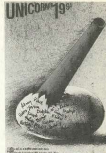
Az Unicornis kiállítás plakátja. Vigadó Galéria, 1991. március 1-jétől 24-ig