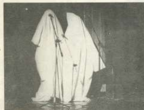
„Új modern akrobatika”