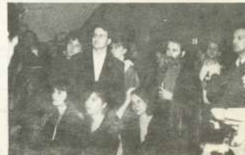
Nézőközönség a Barlangban