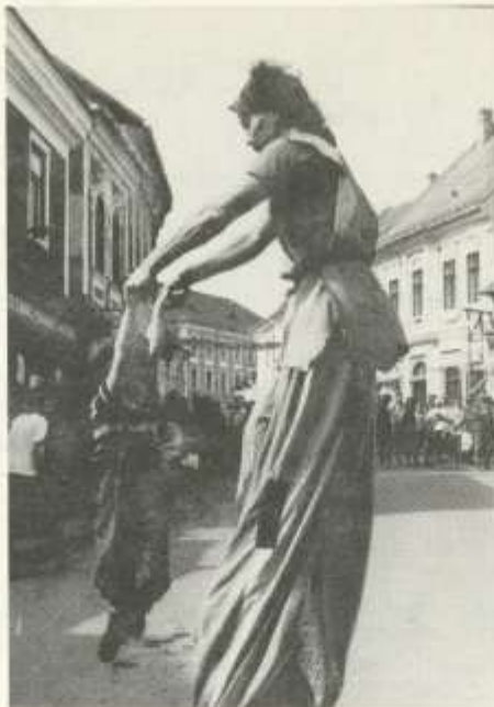
Maskarások a Fő téren