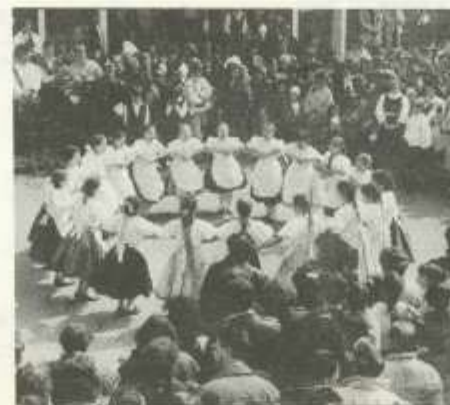
Húsvéti táncház a Fő téren március 31-én