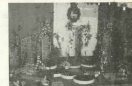
Virágkiállítás a Városháza Dísztermében.