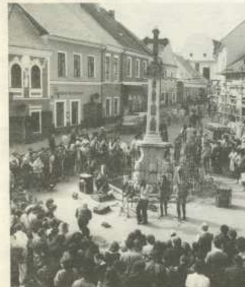
Waslavik Gazember műsora a Fő téren