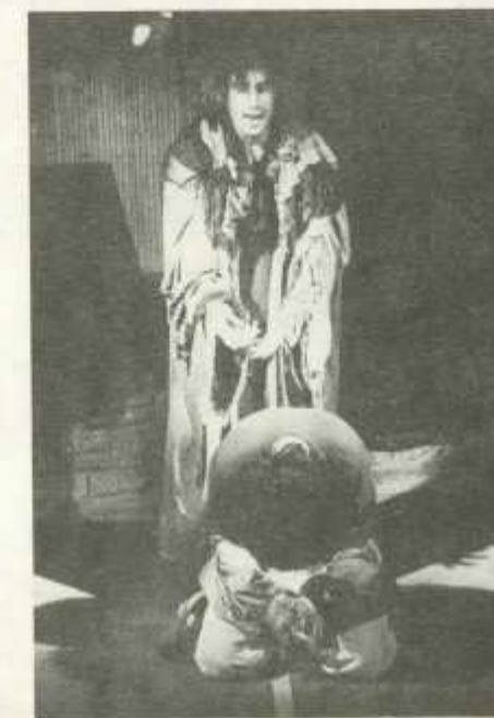
A fanatikus zenekar. Az Andaxinház előadása