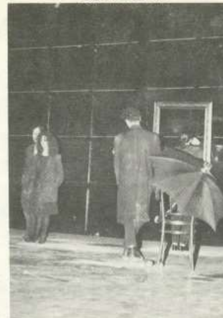
„Escorial”. A Független Színpad előadása március 22-én a Barlangban