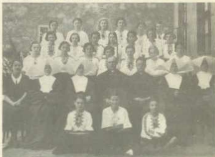
Osztálykép az „Irgalmasoktól” (ma Bajcsy-Zsilinszky úti Iskola)