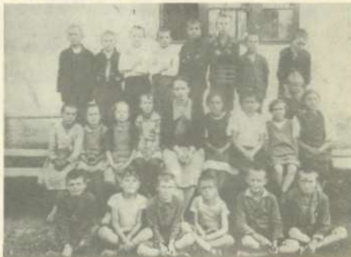
Izbégi osztálykép 1929-ből

Részlet a Szent-Endre és Vidéke Hírlapja 1904. november 6-4 számából: „A szentendrei római katolikus tanítók anyagi nyomora ismét megkezdődött. Fizetésüket nem kapják meg rendszeresen. Hát hol marad az intézkedés, mellyel a tanítók következetes ellátását biztosítják? A deficitet hitközzel azzal