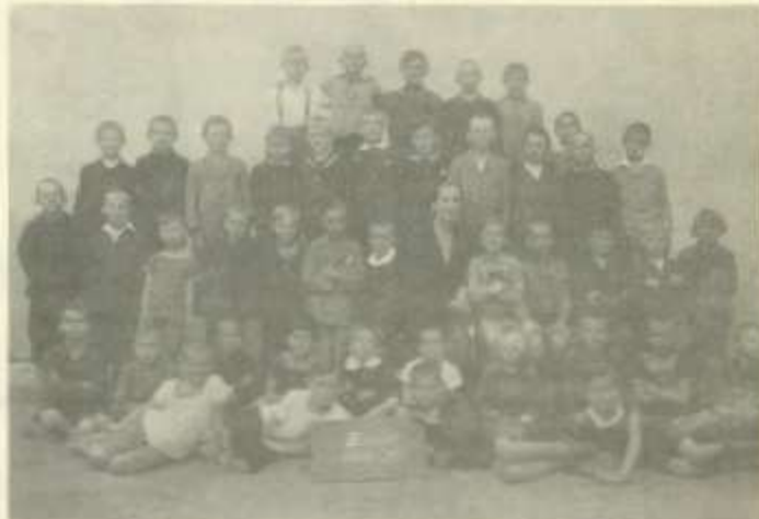
Osztálykép a mai Templomdombi Iskolából