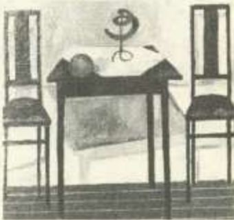
Tóth Szűcs Ilona: Csendélet

Bár a két pálya Tóth Szűcs Ilona váratlan és tragikus haláláig (1990) egy íven futott, a két oeuvre független egymástól.